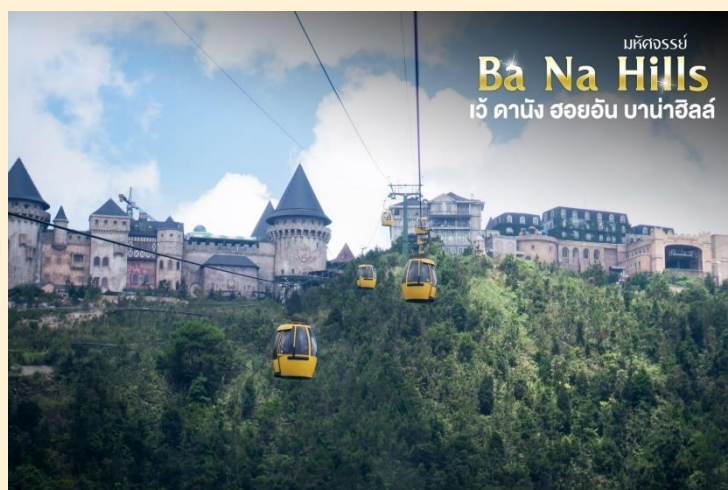
มหัศจรรย์ Ba Na Hills เว้ ดานัง ฮอยอัน บานาฮิลล์

กระเช้าแห่งบานาฮิลล์นี้ได้รับการบันทึกสถิติโลกโดยWorld Record ว่าเป็นกระเช้าไฟฟ้าที่ยาวที่สุดประเภท Non Stop โดยไม่หยุดแะมีความยาวทั้งสิ้น 5,042 เมตรและเป็นกระเช้าที่สูงที่สุดที่ 1,294 เมตรนักท่องเที่ยวจะได้สัมผัสปุยมะหมอกและบางจุดมี