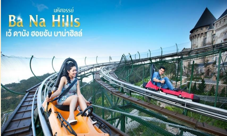
มหัศจรรย์ Ba Na Hills เว็ ดานิง ฮอยอัน บานาฮิลล์