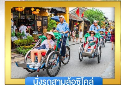
นั่งรถสามล้อชิโคล์