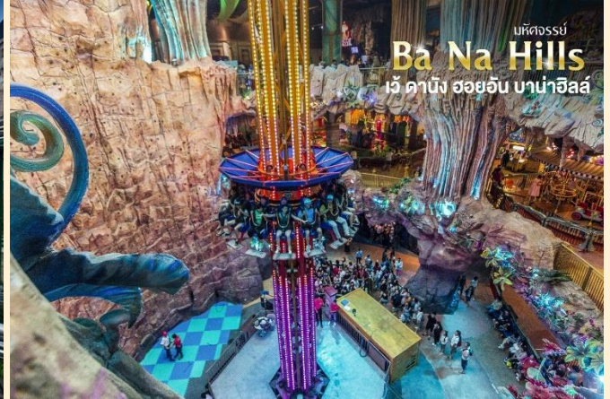
มหัศจรรย์ Ba Na Hills เว็ ดานิง ฮอยอัน บานาฮิลล์

ชมเมืองฝรั่งเศส เป็นตึกออกแบบมาได้บรรยากาศยุโรปแท้ๆแต่มาเจอได้ใกล้ๆเพียงแค่วียดนาม ลัดเลาะไปตามตรอกซอกซอย มีมุมถ่ายรูปเชิ่คอินสวยๆหลายมุม Le Jardin d' Amour เป็นสวนสวยสไตล์ฝรั่งเศส ที่มีทั้งดอกไม้ต้นไม้ มีมุมถ่ายรูปสวยๆ เต็มไปหมด รวมไปถึงมี โรงไวน์ Debay Wine Cellar อีกด้วยค่ะ เราเดินไปเที่ยวด้านในจะเป็นคล้ายๆ อุโมงค์ใต้ดินไว้บ่มไวน์ เป็นทางยาว เดินทะลุชมไปเรื่อยๆ ก็จะออกมาที่สวน นอกจากนี้ เดินไปไม่กี่ไกลยังมีพระพุทธรูปองค์ใหญ่สีขาวสูงถึง 27 เมตรอีกด้วย ให้ท่านเพลิดเพลินไปกับบานาฮิลล์ โซนใหม่ Eclipse Square ตามอัธยาศัย