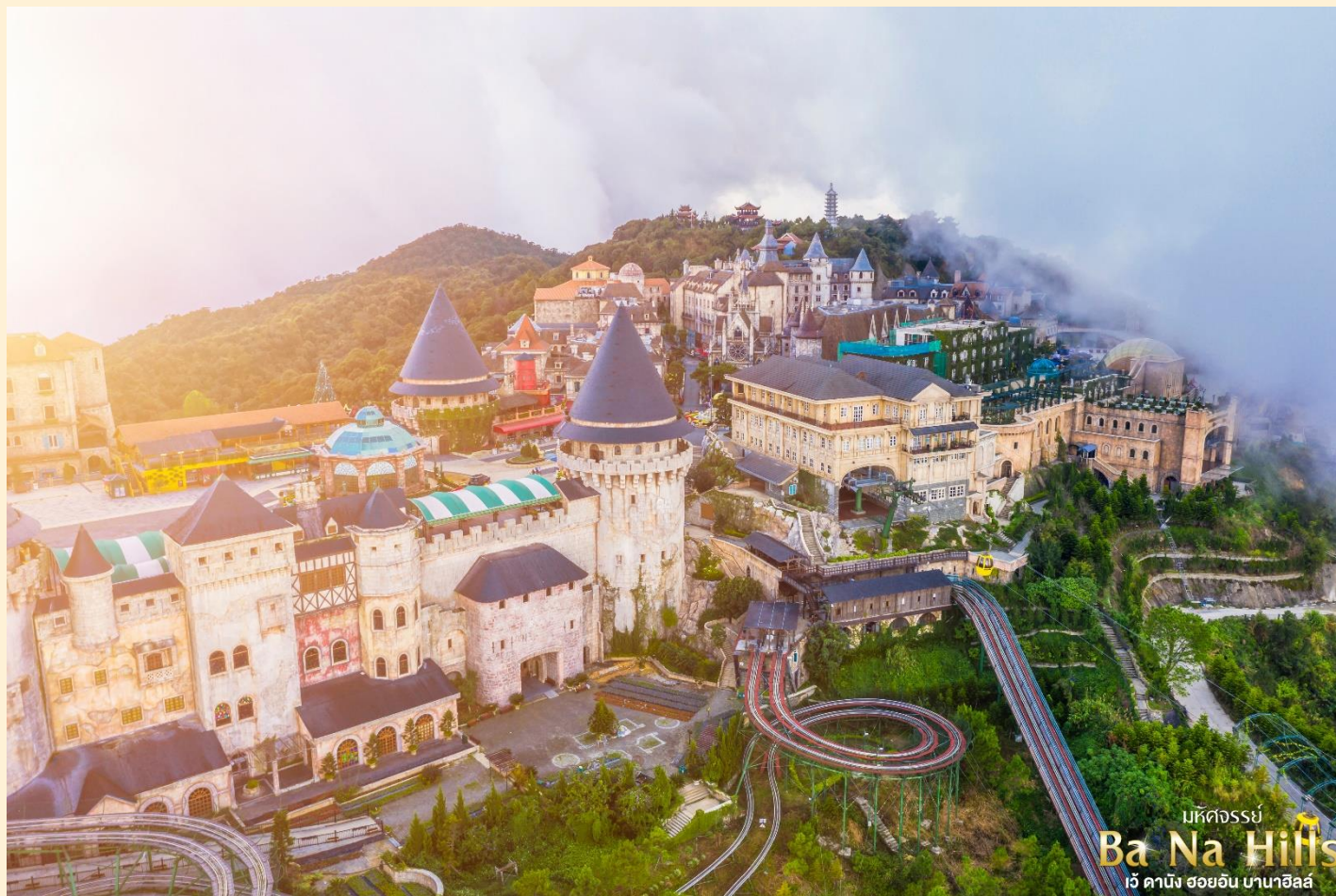
มหัศจรรย์ Ba Na Hills เว้ ดานัง ฮอยอัน บานาฮิลล์