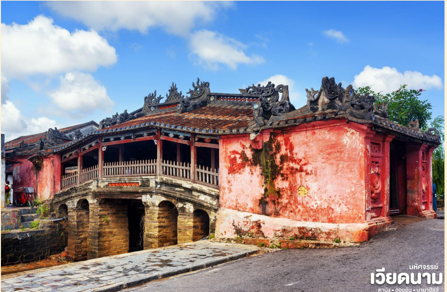
มัทศจรรย์ เวียดนาม ดานัง • ฮอยอัน • บานาฮิลล์

ญี่ปุ่นและที่ฮอยอันชาวบ้านจะนำสินค้าต่าง ๆ ไว้ที่หน้าบ้าน เพื่อขายให้นักท่องเที่ยวท่าน สามารถซื้อของที่ระลึก เป็นของฝากกลับบ้านได้อีกด้วย เช่น กระเป๋าโคมไฟ เป็นต้น