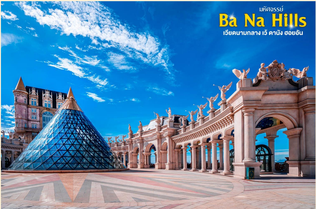
มหัศจรรย์ Ba Na Hills เว็ ดานิง ฮอยอัน

ชมเมืองฝรั่งเศส เป็นตึกออกแบบมาได้บรรยากาศยุโรปแท้ๆแต่มาเจอได้ใกล้ๆเพียงแค่วียดนาม ลัดเลาะไปตามตรอกซอกซอย มีมุมถ่ายรูปเชิ่คอินสวยๆหลายมุม Le Jardin d' Amour เป็นสวนสวยสไตล์ฝรั่งเศส ที่มีทั้งดอกไม้ต้นไม้ มีมุมถ่ายรูปสวยๆ เต็มไปหมด รวมไปถึงมี โรงไวน์ Debay Wine Cellar อีกด้วยค่ะ เราเดินไปเที่ยวด้านในจะเป็นคล้ายๆ อุโมงค์ใต้ดินไว้บ่มไวน์ เป็นทางยาว เดินทะลุชมไปเรื่อยๆ ก็จะออกมาที่สวน นอกจากนี้ เดินไปไม่กี่ไกลยังมีพระพุทธรูปองค์ใหญ่สีขาวสูงถึง 27 เมตรอีกด้วย ให้ท่านเพลิดเพลินไปกับบานาฮิลล์ โซนใหม่ Eclipse Square ตามอัธยาศัย